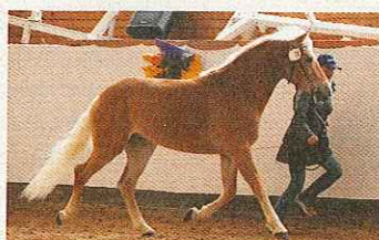
Lörcher von Aristokrat