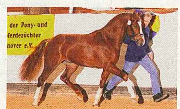
Lord L, Besitzer: Köster-Beermann